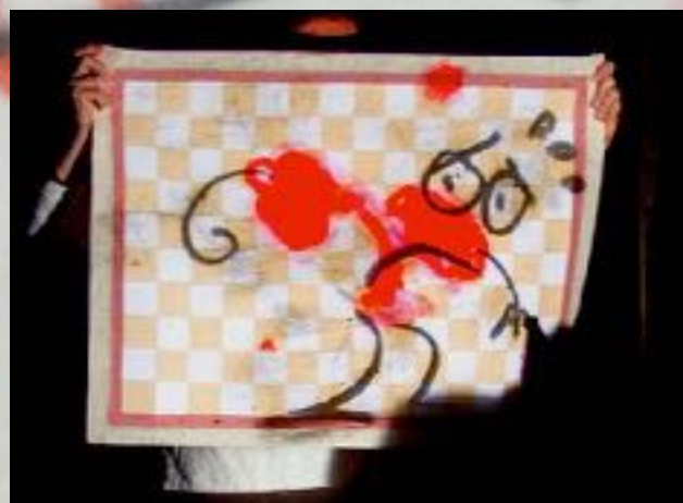
una macchia di sugo